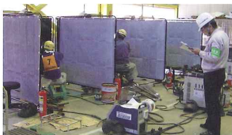
鉄筋溶接技量検定試験状況