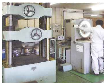
A級継手性能確認試験状況